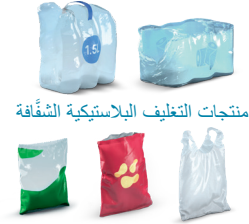
منتجات التغليف البلاستيكية الشفافة