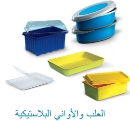
العلب والأواني البلاستيكية