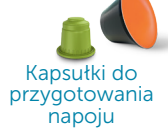
Kapsułki do przygotowania napoju