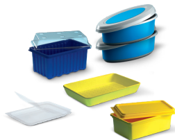
Tacki i miseczki