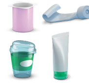
Kubeczki i tubki